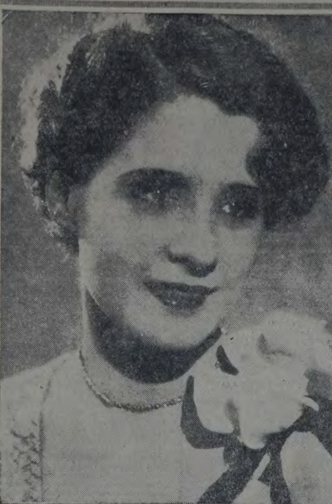
LA AGRADABLE E INTELIGENTE ACRIZ DE LA METRO-GOLDWYN-MAYER, protagonista de la película "La locura del placer", estrenada anoche en los cines centrales.