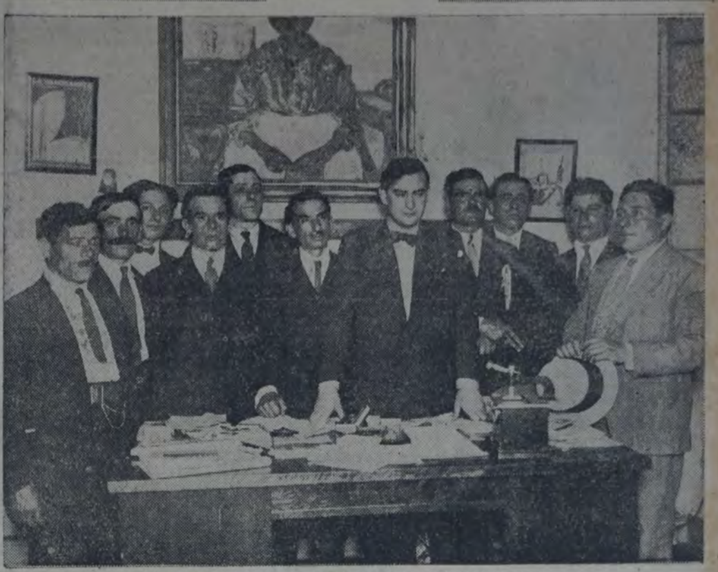
LOS DELEGADOS EN LA REDACCION DE "LA VANGUARDIA"

Hemos recibido la grata visita de una nutrida delegación de la "Unión Vecinal y biblioteca popular Nuevo Horizonte", con secretaría en la calle Taft 850. Departimos larga y agradablemente con esos ciudadanos que se preocupan no solamente de obtener las mejoras edilicias para el barrio, sino de crear un poco de cultura popular. En nombre de "Nuevo Horizonte", agradecieron a "La Vanguardia" su preocupación por conocer las necesidades edilicias de los barrios suburbanos, y expresaron la simpatía con que el vecindario de Villa Nuevo Horizonte seguía nuestra tenaz campaña. Expresáronnos, asimismo, su adhesión a la obra tenaz, inteligente llevada a cabo por los concejales socialistas en el concejo deliberante, cuyos puntos de vista, cuya ideología compartían amplia y decididamente. Insistieron en el alto significado moral de su visita al diario del Partido Socialista, que debe interpretarse como la más franca expresión de solidaridad con nosotros y nuestra acción de reforma política y social. Afirmaron luego que las aspiraciones edilicias de Villa Nuevo Horizonte coincidía totalmente con la plataforma electoral del Partido Socialista. Por eso, consecuentes y respetuosos de sus convicciones, han resuelto apoyar al Partido Socialista en esta cam-