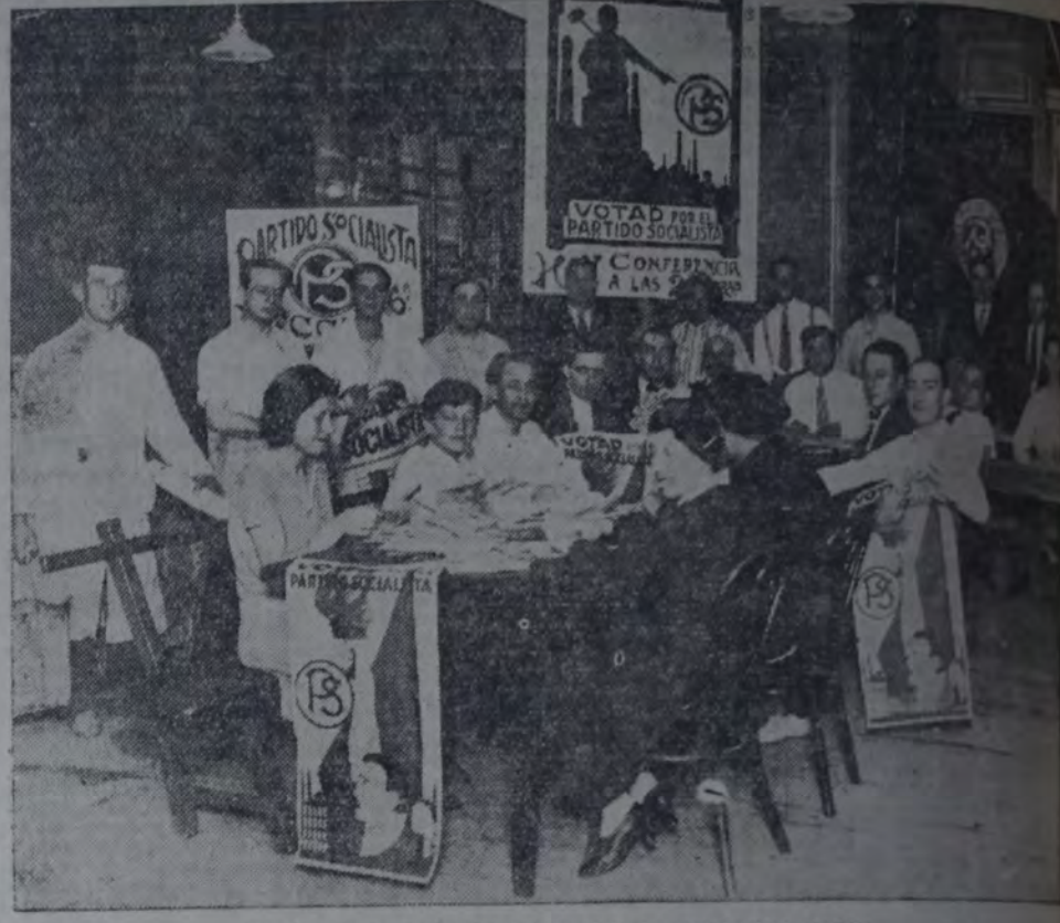
EN EL LOCAL DEL CENTRO DE LA 6a. EN PLENA TAREA

Enviar "La Vanguardia" a 4720 inscriptos en el padrón.—El gran acto público de mañana