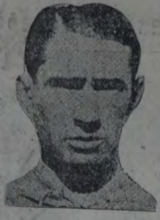
CUYA REAPARICION EN EL equipo del Racing, se anuncia para hoy.