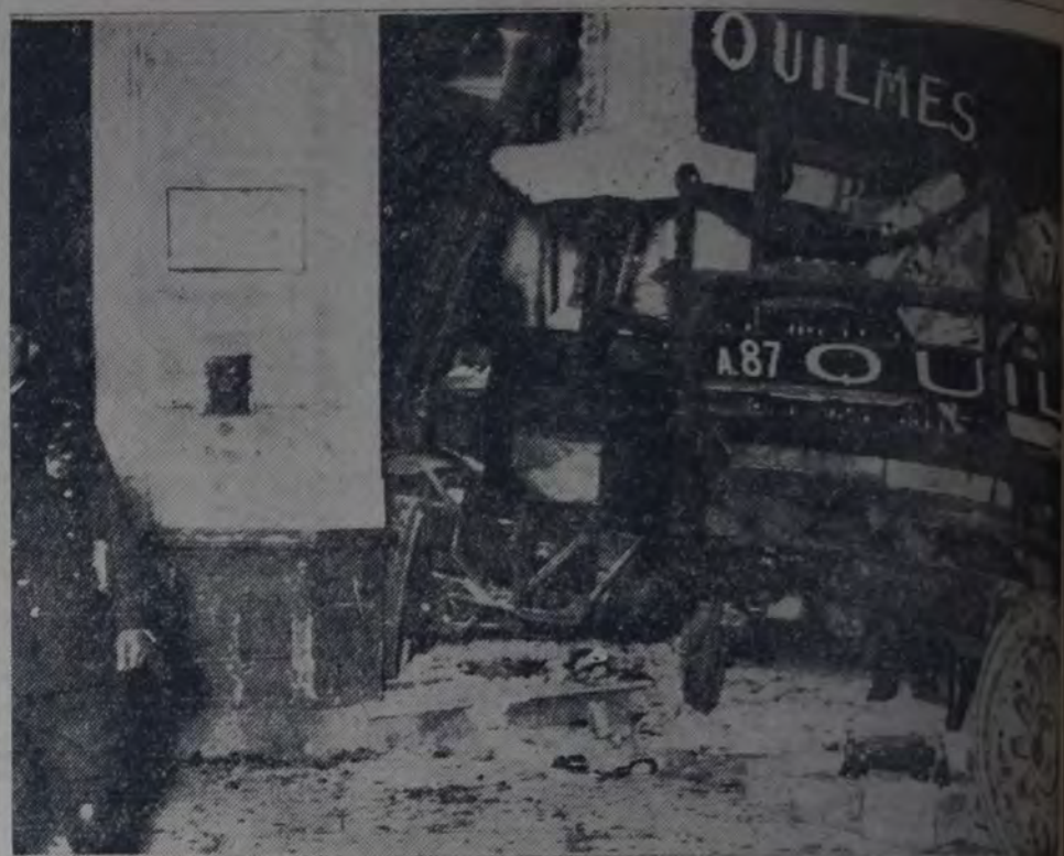
LA FOTOGRAFIA MUESTRA CÓMO QUEDÓ EL FRENTE DEL ALMACÉN CONTRA EL CUAL SE ESTRELLÓ EL CAMIÓN.

El vehículo siguió reclusamente por 25 de Mayo hasta el cruce, y al llegar